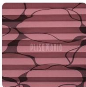
Aida Print 02