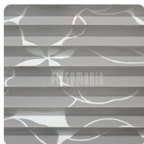
Aida Print 01