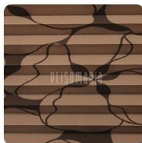
Aida Print 03