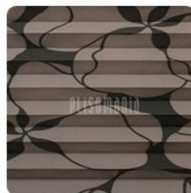
Aida Print 04